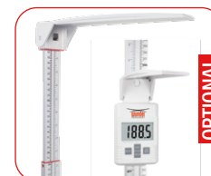
Statimetro telescopico manuale: Lettura digitale o serigrafata