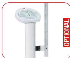
Versione con Statimetro posizionato lateralmente