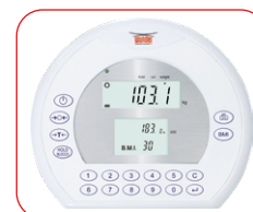
Visore a tripla lettura Peso Altezza BMI