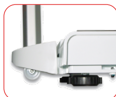
Ruote per il trasposto - Piedini regolabili