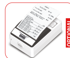
Stampante termica per Peso e BMI