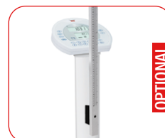
Versione con Statimetro posizionato centralmente